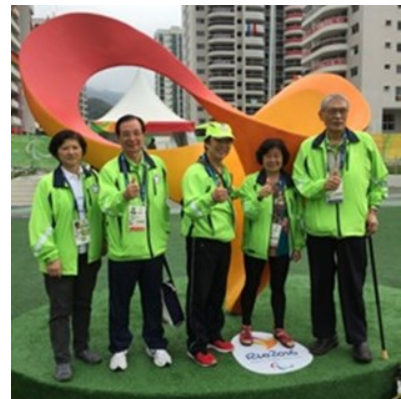
2016 年巴西帕運會後 結束殘障運動生涯