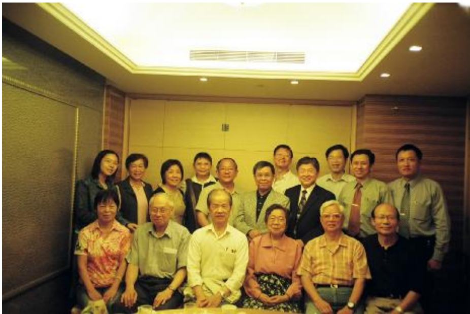
95年9月24日交接大會，並邀請師長共慶教師節，攝於庭園餐廳。